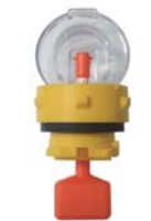
フロート付き 液栓キャップ